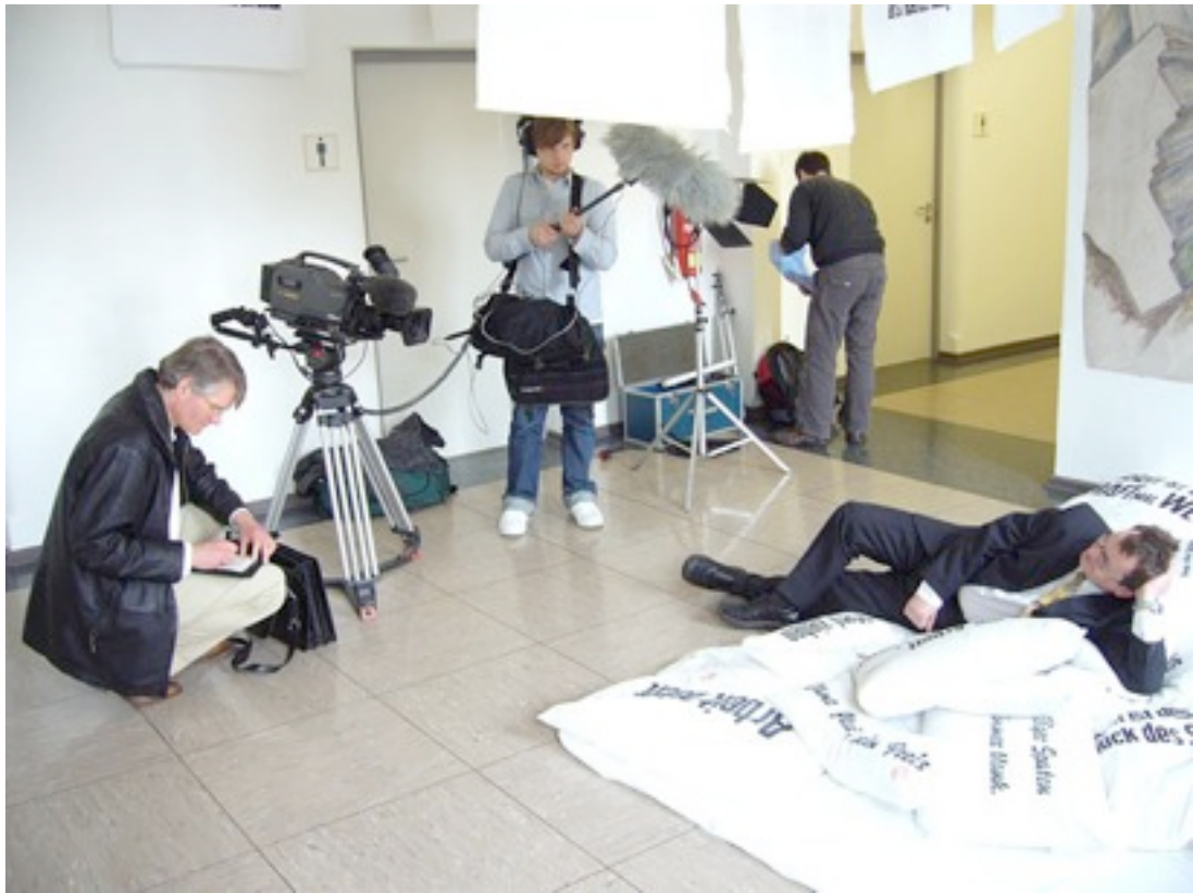
Bayrischer Rundfunk vor Ort am 16.4.2008